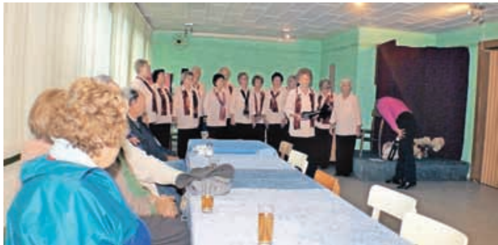
Pevke so navdušile z nastopom v sproščenem vzdušju.