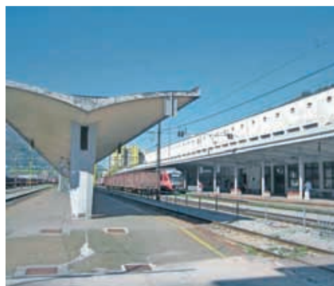
Železniška postaja z južne strani