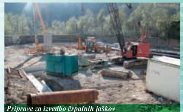
Priprave za izvedbo črpalnih jaškov

Kljub začetnim težavam s nivojem podtalnice in črpanjem ter z žlindro v obstoječih nasipih, ki so povzročile kar nekaj zamude pri gradnji centralne čistilne naprave, dela zdaj tako pri centralni čistilni napravi kot pri gradnji kanalizacije potekajo po zastavljenih načrtih, s tem da se skrajšuje doba poskusnega obratovanja čistilne naprave. Trenutno so tako izvedena gradbena dela na obeh sekundarnih usedalnikih in varovanje gradbene jame s pilotno steno za strojnico ter aeracijski bazen, izvajajo se črpalni jaški za znižanje podtalnice za potrebe izgradnje strojnice in aeracijskega bazena.