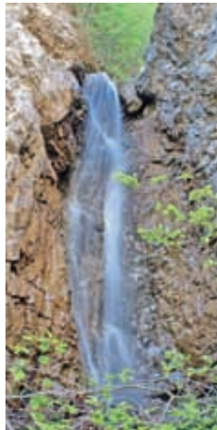
Drugi slap, mimo katerega je vodila pot, zaščiten z jeklenico, ki jo je odnesla zadnja povodenj.

steno levo od njega vklesane gladke stopnice, nekoč pa jih je varovala tudi jeklenica, od katere pa so ostali le še trije zarjaveli klini. Tako je pot naprej za nekoga brez plezalnih izkušenj zelo težka, še težje pa je nadaljevanje poti od tretjega slapu. Še pred prvim slapom se je treba prebijati preko polomljenega drevja, podorov in razrite struge, ki kaže bes narave v zadnjih letih. Oko večkratnega obiskovalca soteske te spremembe hitro opazi. Vsekakor soteske ne priporočamo za nedeljski izlet, za izkušenejšo planince pa lahko predstavlja pravi izziv. Izziv pa predstavlja tudi za prihodnost Jesenic, vsaj z razmislekom o ponovni turistični ureditvi soteske in njeni vrnitvi na nekdanja pota slave.