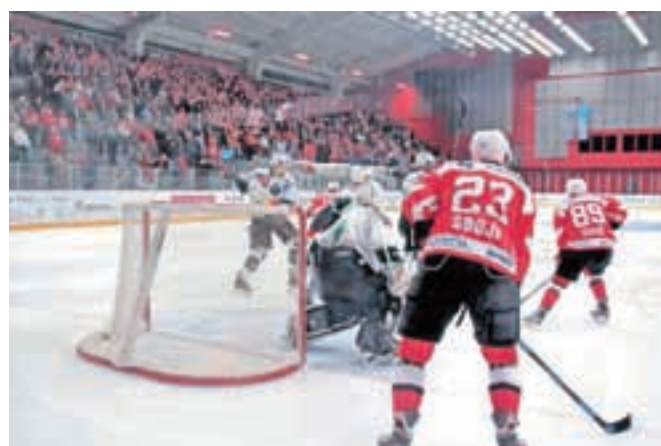
Kljub porazu s 4:2 so bili gledalci večinoma enotni, da so videli kvalitetno hokejsko tekmo in da to Jesenice potrebujejo.