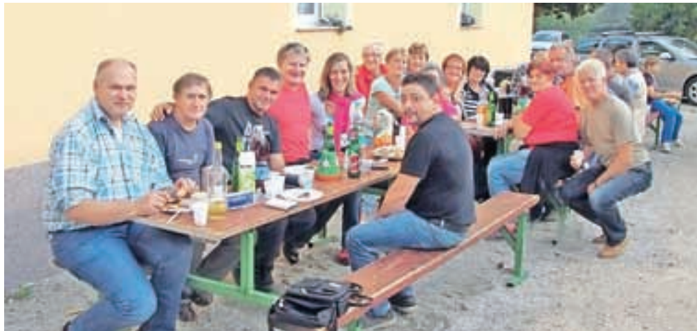
Ob zaključku prenove fasade so pripravili prijetno druženje.

V večstanovanjski stavbi Hrušica 70 je 22 stanovanjcev zagotovo lahko za vzor, kako premostiti včasih kar resne težave z ogrevanjem in urejenostjo bivalnega okolja. Leta 2012 so najprej pogumno izpeljali prvo zahtevnejšo investicijo. Med več možnostmi so se odločili za ogrevanje z zemeljskim plinom. Izvajalec jim je postavil najbolj sodobno kotlovnico, ki je bila prva takšna v občini Jesenice. Optimistična napoved s prihrankom