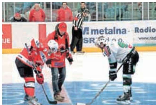
Prvi plošček na drugem letošnjem večnem derbiju med HDD SIJ Acroni Jesenice in Telemach Olimpijo je vrgel skakalni šampijon Peter Prevc.

Kljub porazu in dejstvu, da Telemach Olimpija na Jesenice ni prispela v postavi, s katero nastopajo v ligi EBEL, ljubitelji hokeja drugega letošnjega derbija niso zapustili razočarani.